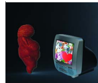
Gerhard Haug: »Die Gedanken der Venus«, 2009