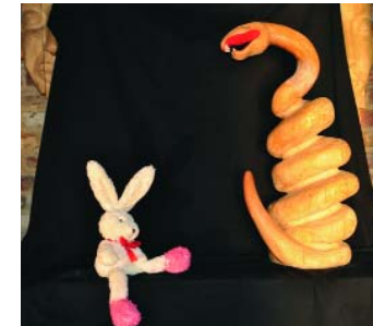
Rolf Hemmerich: »Bunny und Schlange«, 2009